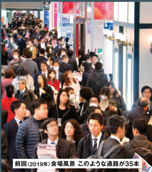
前回(2019年)会場風景 このような通路が35本